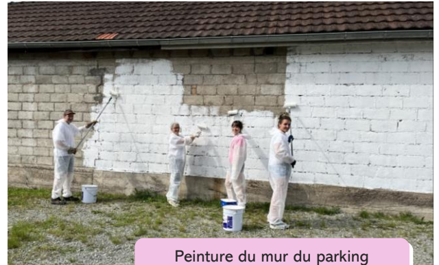
Peinture du mur du parking de l'École élémentaire