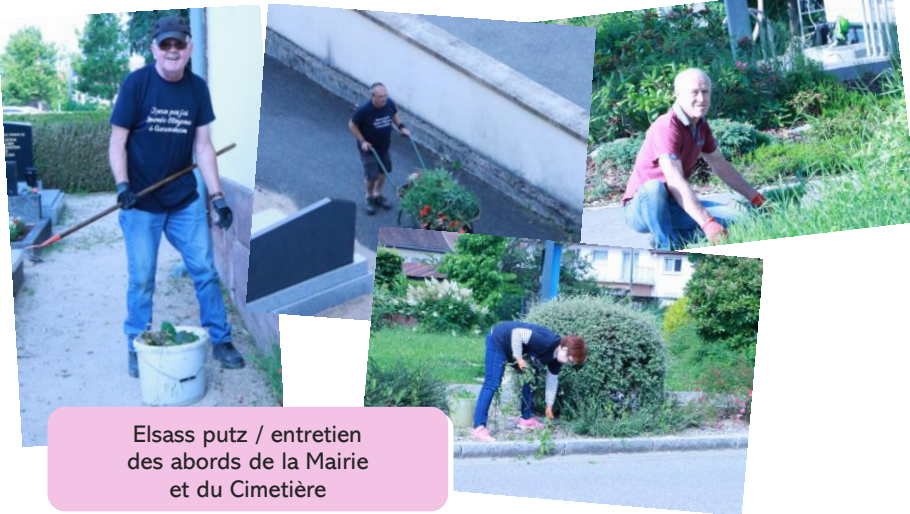
Elsass putz / entretien des abords de la Mairie et du Cimetière