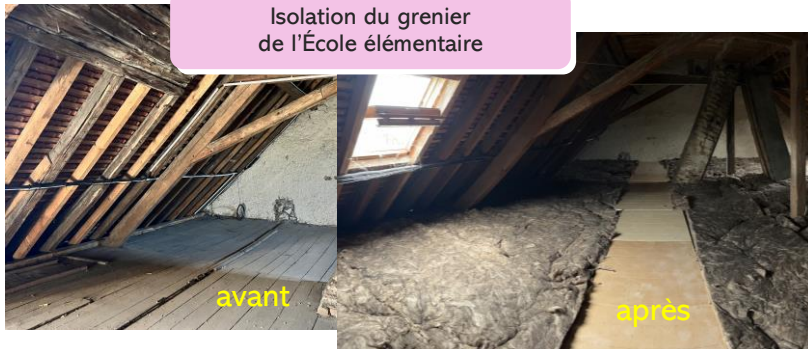
Isolation du grenier de l'École élémentaire