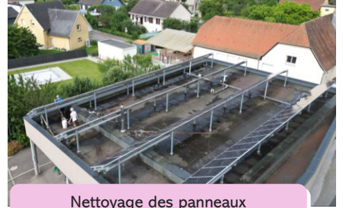
Nettoyage des panneaux photovoltaïques de la Mairie

Un grand merci à toutes et à tous pour votre participation, votre engagement et votre bonne humeur qui restent le gage de réussite de la journée.