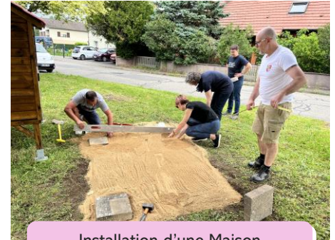
Installation d'une Maison bibliothèque