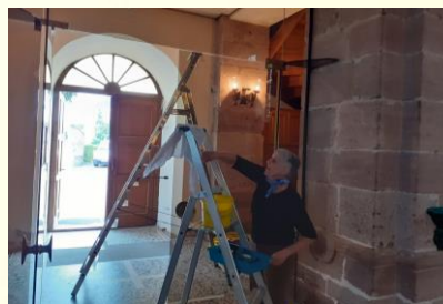
Nettoyage de la porte de l'Eglise