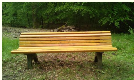
Remise en état d'un banc dans la forêt