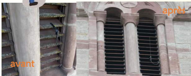
Remise en état d'une partie des « abat-sons » du clocher de l'Eglise