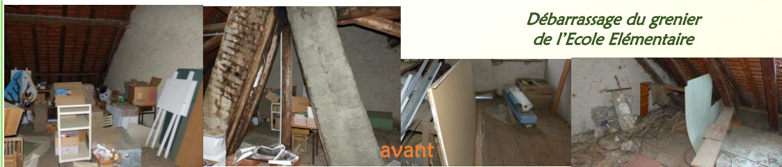
Débarrassage du grenier de l'Ecole Elémentaire