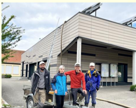
Nettoyage des panneaux photovoltaïques de la Mairie