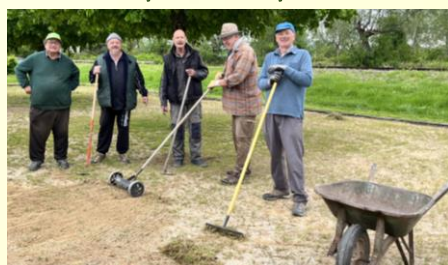
Entretien du boulodrome