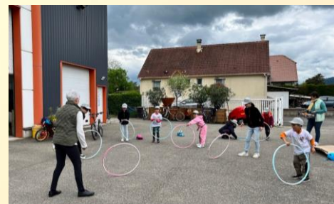
Atelier pour les enfants

Merci à tous les volontaires qui ont permis la bonne réalisation de tous les chantiers prévus ... du plus simple au plus ambitieux, sans oublier les « itinérants » qui ont sillonné les routes et chemins pour « l'Elsassputz » !