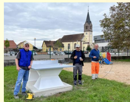
Installation d'une table de ping-pong