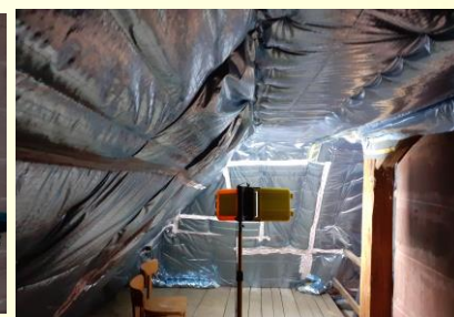
Isolation du grenier de la Sacristie