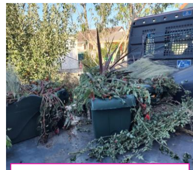
Enlèvement des jardinières et suspensions de la Commune

Bravo aux lauréats et merci à tous les participants qui aident à faire de notre village un endroit où il fait bon vivre !