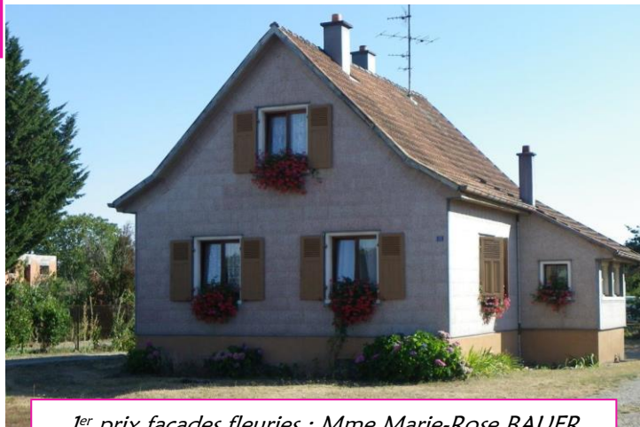
1 er prix façades fleuries : Mme Marie-Rose BAUER